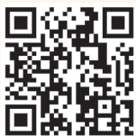
Facebook QR Code