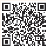
Instagram QR Code