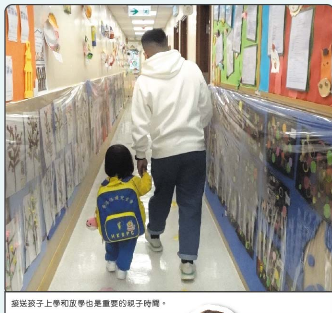
接送孩子上學和放學也是重要的親子時間。

事實上，優質的親子時間並非以時數作衡量，父母可以每天都花數小時陪伴孩子，但雙方相處於平行時空，並沒有交叉點。例如，孩子在客廳中自己進行活動，與家長完全沒有互動，父母坐在沙發只顧低頭工作，當孩子興致勃勃的向家長表達自己快樂的心情時，卻只得到「嗯」、「你自己玩，我在忙」等回應，相信孩子往後都未必會再主動與家長分享個人感受。然而，家長卻可能認為自己在孩子身旁便是親子時間，又或者因為忙著各樣瑣事而忽略了孩子的感受。其實，孩子心裡並不在乎時間的長短，而是彼此之間的溝通和互動。