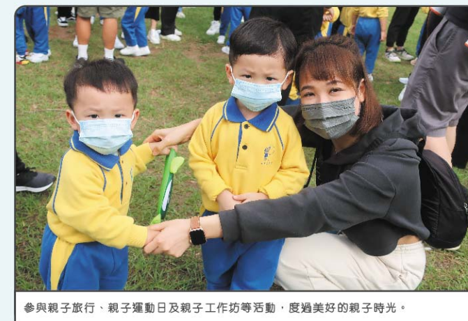
參與親子旅行、親子運動日及親子工作坊等活動，度過美好的親子時光。

父母與孩子的角色不會因為孩子長大而有所改變，孩子一路成長，父母也不忘親子時間的重要性，便可一代一代的延續下去，常享天倫之樂！