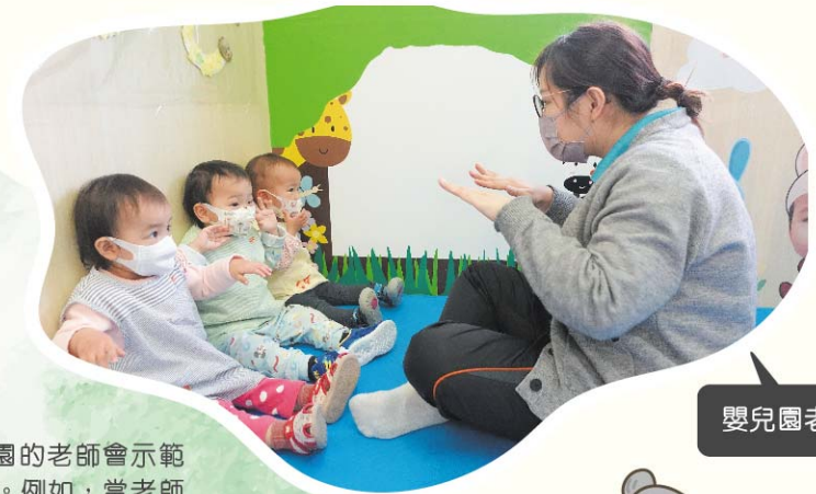
幼兒園老師教導嬰幼兒手語

到了七、八個月大，孩子能較自如地控制上臂及頸部肌肉，亦開始與其他孩子作社交互動時，幼兒園的老師會鼓勵孩子和別人打招呼及道別，例如雙眼正視對方，並點頭或揮手，讓他們養成與他人禮貌互動的習慣。