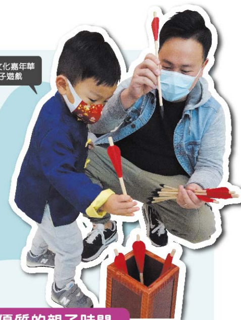
中華文化廳年華親子遊戲