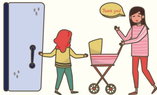
讚許孩子有禮貌的行為

禮貌代表一種為他人著想的態度與習慣，「有禮貌」往往予人良好的印象，家長當然都想孩子成為受人歡迎的寶寶。可是，嬰幼兒本來就視自己為世界的中心，他們不一定懂得回應別人的請求或需要；再加上保護自己的自然反應，遇見不太熟悉的人，寶寶第一反應往往是警戒與退縮。那麼，家長可以如何培養有禮貌的寶寶呢？