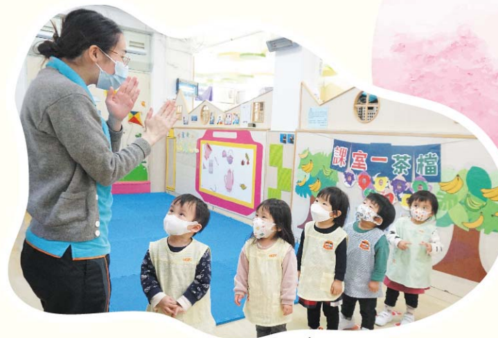
排隊輪候去洗手間