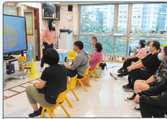
家長可參加學校舉辦的專題講座，學習育兒知識，促進親子效能。

其實，接送孩子上學和放學都是一個不錯的親子時間呢！不要小看回校途中短短的數分鐘或數十分鐘，透過說話、身體語言，及接觸不同的人 and 事，可了解幼兒的興趣及觀察孩子的成長，藉以增加與孩子的互動，這些零碎的時間也能緊密維繫彼此。家長亦可以於放工回程的交通時間，致電小情人閒談幾句。在假日，未必所有家庭都有時間帶孩子親親大自然，但也可考慮其他幼兒喜歡的活動——好像乘坐公共交通工具，其實乘車、乘船都能為孩子帶來不同的體驗呢！